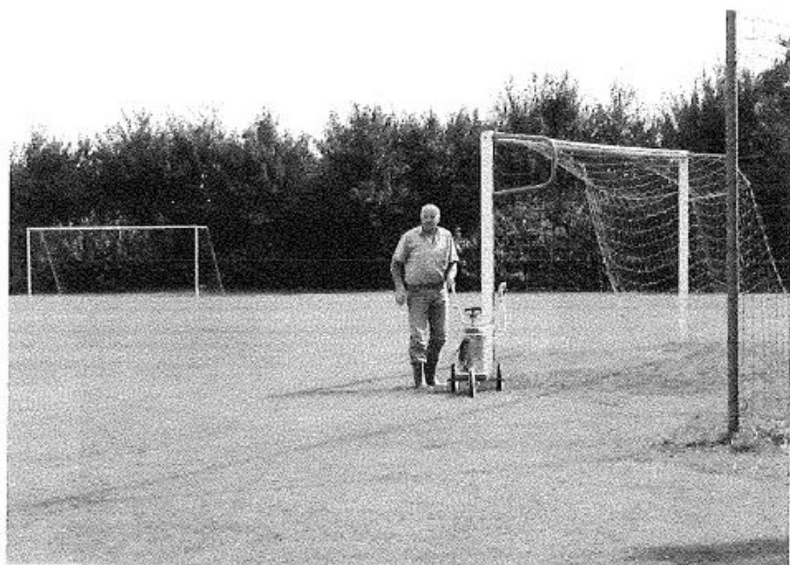
Eén van de terreinmeesters kalkt de lijnen voor de bekerwedstrijden 29 augustus 2001