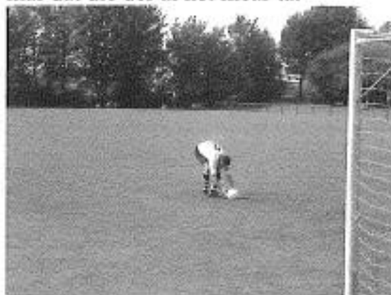
Jeroen leit de bal klear foar syn pingel.

Om 14.00 oere koe SDS 2 dan eindliks los. SDS 2 begie knap tsjin Wolvega en kaam mei 1-0 foar. It wie Dennis dy 't ûnmooglik skoorde. Mei in gang as in kûgel en de bal oan 'e foet gie hy lâns de line. Willem en Skelte stienen foar de goal te wachtsjen op in foarset. Doe 't Willem ropte "twadde peal", kaam de bal der oan silen. Mei in gang as in plysje bedarre de bal by de twadde peal yn 't net, 1-0. Jammer genôch koe SDS 2 it yn de twadde helte krekt net hâlde en makke Wolvega lyk. Nei 2x20 minuten wie it noch altiten 1-1 en mochten der pingels nommen wurde. Wolvega makke se allegear en Jeroen (op 'e peal) en Tseard (pakt troch de keeper) misten foar SDS. Allinne Stefan makke syn pingel, mar dat die der al net mear ta.