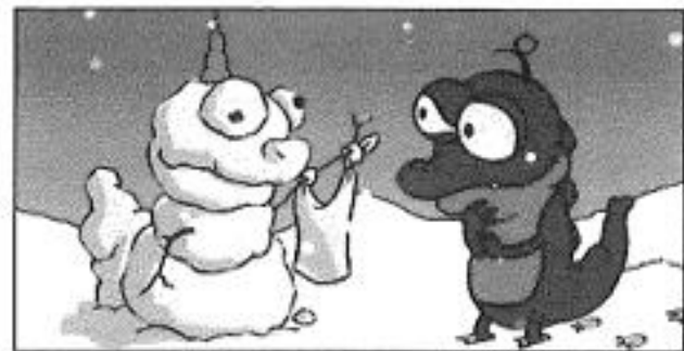
Op it Skrok kin de flagge út.