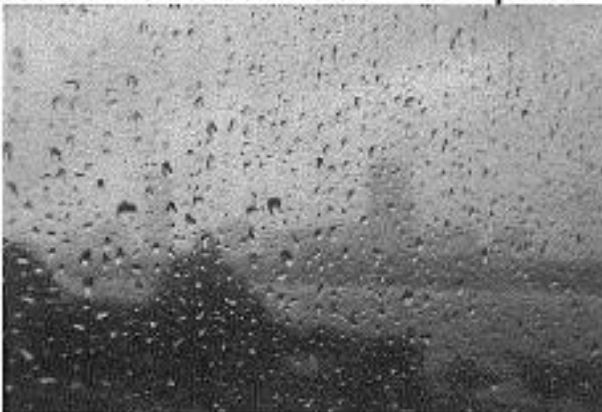
Gerrit stie fan 'e wike as in sintsje te stralen tusken de blomkoalen fan de Jumbo.