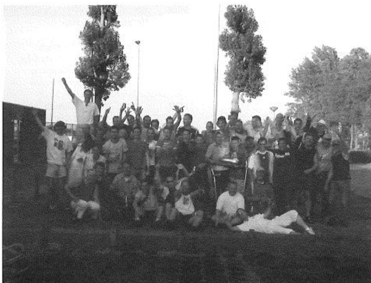
Dizze minsken wienen allegear mei nei Erica.