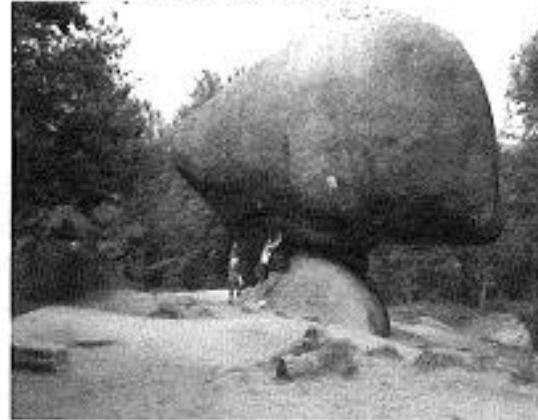
Mei in 2e priis draagt de SDS League seker syn stjintsje by oan Immie har beurs.