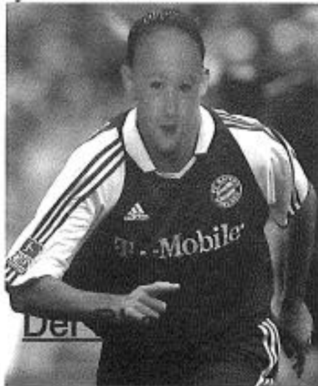
Fansels gie Der PhanTom yn it lêst as in spear.