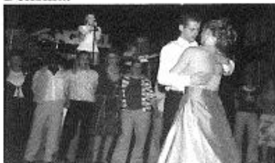
Johan kin it jild fêst wol brûke nei in djoere brulloft.

Hey Ho Let's Go fan Willem Wijnia foel as nûmer 11 krekt bûten de prizen. Yn it lêst moast it allegear nochris wurde. Sa as meastentiids wie dit krekt te let.