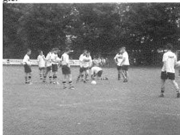
Foar de wedstriid tsjin Germanicus waard der noch efkes oefene op pingels.

de hân en Willem bleaun mei syn pink yn de broek fan syn tsjinstanner hingjen wêrtroch de broek hielendal oan braad gie.