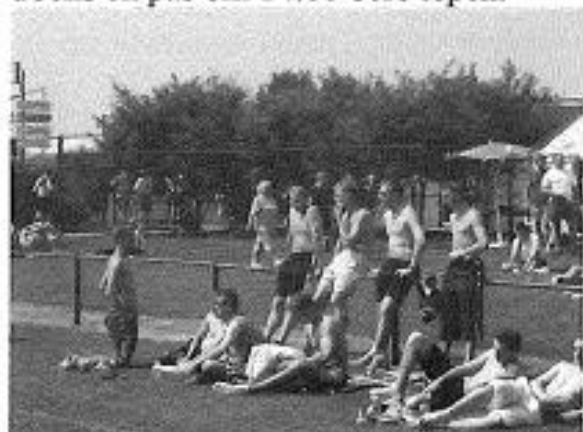
It wie aardich waarm yn Erica

Oankommen yn Erica koenen de SDS 'ers lyk de lotting meimeitsje. Eltse ploech krige in nûmer.: ACV 1, SDS 2, Wolvega 3 en Germanicus 4. Tsjin ACV dus? Nee..... De nûmers 1 en 4 moasten tsjin elkoar en 2 moast tsjin 3. Om 't dizze wedstriden pas om 14.00 oere spile wurde soenen koe der earst noch 2 oeren omhongen wurde. Earst waarden de wedstriden fan de veteranen en de froulju spile. In moaie gelegenheid dus om efkes by it frouljusfuotbal te sjen. De taap gie dochs ek pas om 14.00 oere iepen.