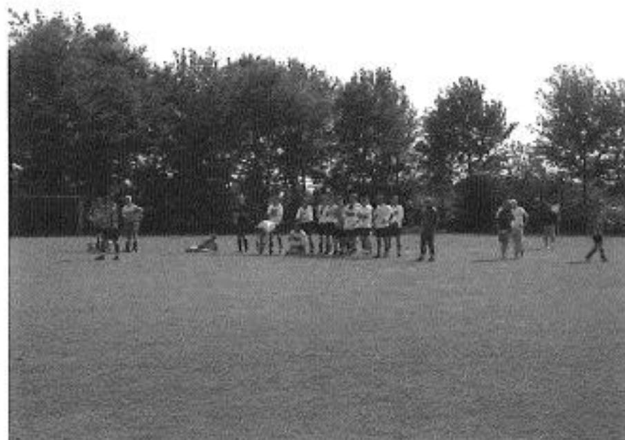
Yn de cirkel wachtsje oan 't it dien is.