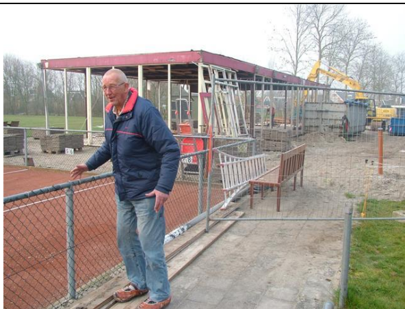
Sjoukema kin it net langer oansjen.

It gefolch hjirfan is neffens har, dat er no in SDS lid is dy’t simmerjassen útsparret en fan winterjassen noch nea heard hat.