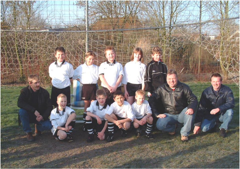
Wylst de'r in teamfoto makke wurdt fan de spilers fan SDS E4, binne de spilers fan SDS F1 dwaande mei de warming-up.